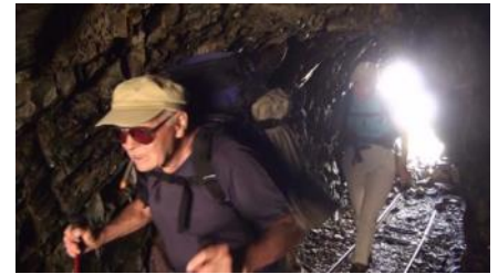
À travers les galeries du Port d'Urets.