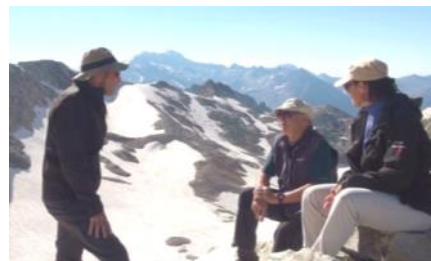
Conclusion au col de Literole.