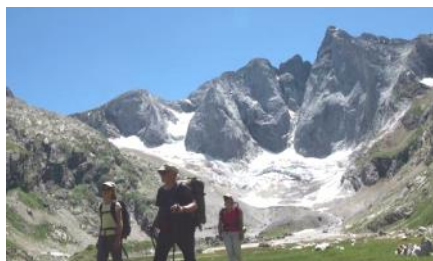
Face nord du Vignemale.