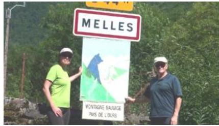
Départ de la traversée au « pays de l'ours ». Le Maubermé, majestueux.

Mais la traversée se poursuit cependant : du « pays de l'ours » à l'emblématique Maubermé, des sites miniers le la frontière ariégeoise au méconnu Certascan... On s'y repren-