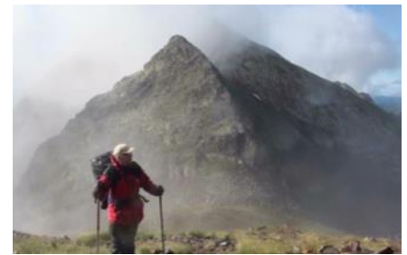
Sandrine indisponible... Michel poursuit en solitaire et s'offre le Certascan.

un film de René Dreuil produit par « Photo Vidéo Création 47 » 1h45