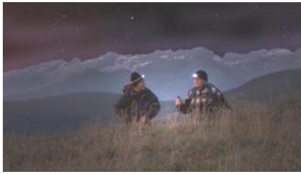
Préambule nocturne sur le Mont Né.