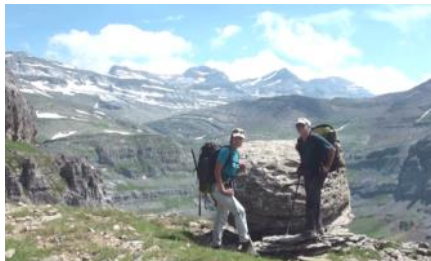
Sortie de la Faja face au Mont Perdu.