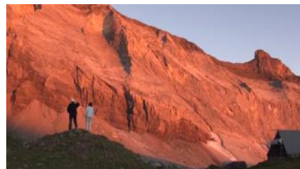
Premières lueurs à Barroude.

Tout au long du chemin, nous faisons un peu plus connaissance avec les marcheurs. Leur vraie vie, leur vrai caractère s'expriment naturellement à travers les rôles qui leur ont été confiés.