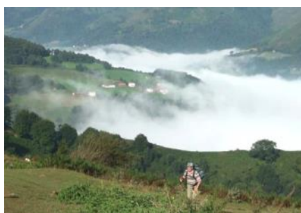
Lucien Delporte en route pour Compostelle